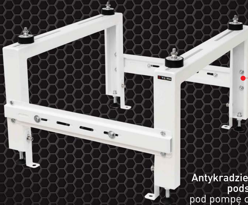
Antykradzieżowa podstawa pod pompę ciepła TEIRA