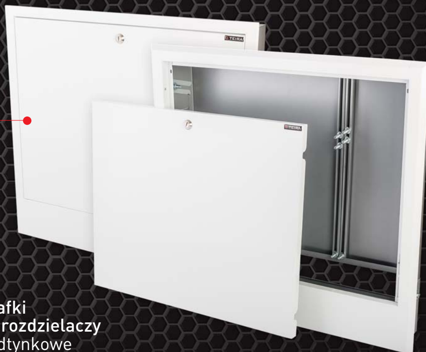
Szafki do rozdzielaczy podtynkowe